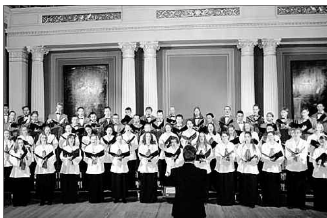
Der Universitätschor Halle gestaltet am 04.12.2009 das Weihnachtskonzert in der St. Trinitatiskirche

Geschäftsstelle Intern. Fasch-Gesellschaft, Wiekhaus Touristinformation, Schloßfreiheit, Zerbst Buchhandlung Gast, Fritz-Brandt-Straße, Zerbst