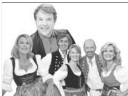
Patrick Lindner und seine Künstlerkollegen präsentieren „Die Sternstunden des volkstümlichen Schlagers“ in der Stadthalle.

Der Vorverkauf läuft. Karten gibt es unter anderem in der Zerbster Tourist-Information, Markt 11, Telefon (03923) 2351.