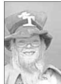
Märchenaufführung für Erwachsene (Rumpelstilzchen)

Die Vereinsmitglieder freuen sich schon jetzt auf einen gemütlichen Tag und auf viele gut gelaunte Besucher.