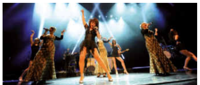
Das Musical kommt am 17.3.2016 nach Dessau-Roßlau