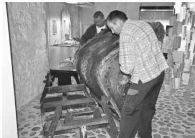
Eine Lore der Zerbster Trümmerbahn bereichert seit kurzem die Sonderausstellung im Museum.

Seit kurzem bereichert zudem eine Lore der Zerbster Trümmerbahn die Ausstellung. Es ist eine Leihgabe der Zerbster Firma Mechanische Werkstatt Enke GmbH. Die Lore gehörte ursprünglich zur Ziegelei Götttschke.