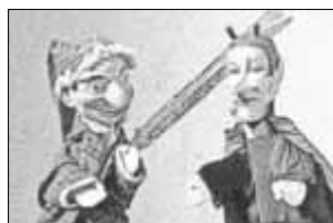
Märchenstunde in der Kirche

Kinderschminken, Laternen- und Fackelumzug, Martinsfeuer