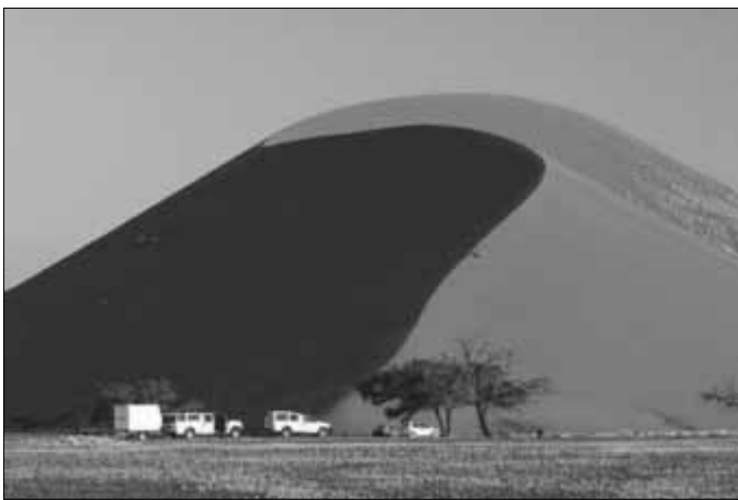
Namibia bietet spektakuläre Landschaften. Kai-Uwe Kückler hat sie erkundet. So auch die höchsten Dünen der Welt in der Namib-Wüste.

Karten für die Veranstaltung gibt es in der Zerbster Tourist-Information.