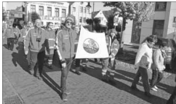
Eine 25-jährige Partnerschaft verbindet die DLRG-Ortsgruppen Zerbst-Roßlau und Schortens-Jever, die sich auch im Rahmen des Brüllmarktes präsentierten.

Eine mehrtägige Begegnung gab es auch zwischen den DLRG-Ortsgruppen Zerbst-Roßlau und Schortens-Jever. Sie konnten ebenfalls eine seit 25 Jahren bestehende Partnerschaft begehen. Dazu gab es einen Jubiläumsempfang am Schortener Sitz der friesischen Ortsgruppe. Außerdem präsentierten sich beide Ortsgruppen am Sonntag des Jeverischen Brüllmarktes im Umzug und mit ihrer Technik für die Besucher im Festgelände.