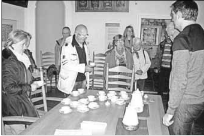
Eine Teepause im Landrichterhaus Neustadtgödens gehörte zum Besuchsprogramm der Mitglieder des Zerbster Heimatvereins.

(Mit Auszügen aus Texten von Helmut Burlager und Jörg Stutz)