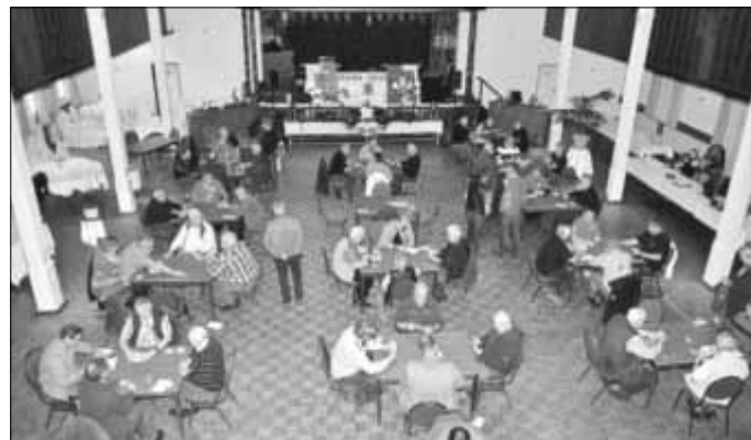
Im 24. Städte-Skat-Turnier im Jeverischen Schützenhof ging der Sieg deutlich an Zerbst.