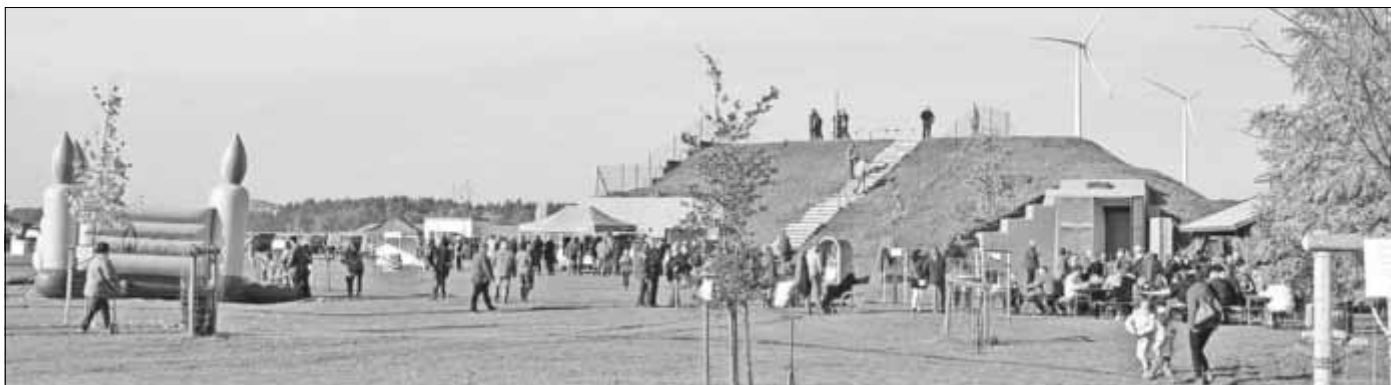
Täglich zugänglich ist jetzt die Begegnungsstätte am Zerbster Flugplatz. Mit einem Tag der offenen Tür wurde sie eingeweiht.