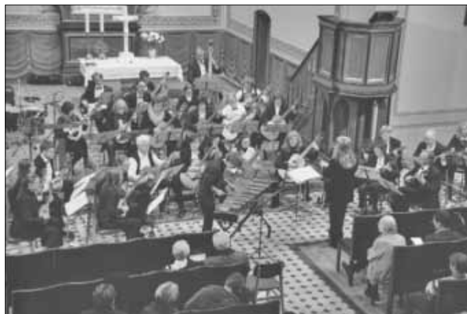
Das Anhaltinische Zupforchester gastiert in der Zerbster St. Trinitatiskirche.

Der Eintritt ist frei. Spenden am Ausgang sind willkommen.