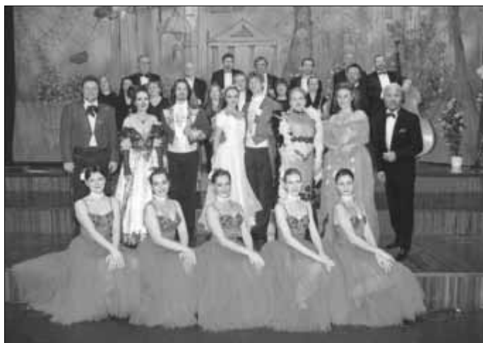
Mit dem „Zauber der Operette“ beginnt das neue Jahr in der Zerbster Stadthalle.

Karten im Vorverkauf gibt es in der Zerbster Tourist-Information.