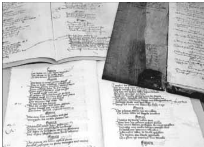
Seltene Einblicke in das Historische Stadtarchiv bieten Führungen am Tag der Archive.

„Rund um die Welt“ beim Frühlingskonzert. Julia und Max zieht es hinaus in die Welt. Sie lernten in Liedern, Tänzen und Gedichten andere Menschen und andere Länder mit ihren Schönheiten und ihrem Liedgut kennen. Überall ist es schön! Doch bald merkten sie, wo es am schönsten ist, nämlich in der Heimat. Gerade als sie zurückkehrten, begann die Frühlingszeit. Sie freuten sich an dem neuen Grün, an Blumen und Schmetterlingen. Dieses Frühlingsgefühl wollen auch die Kinder der Grundschule An der Stadtmauer ihrem Publikum beim Frühlingskonzert am Mittwoch, dem 9. März, um 16 Uhr in der Stadthalle vermitteln und selbst erleben.