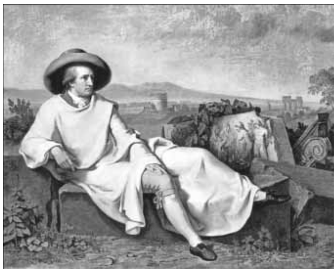
Johann Wolfgang von Goethe legte stets Wert auf gute Kleidung.

Der Eintritt zur Veranstaltung ist kostenlos, es wird jedoch um eine Spende gebeten.