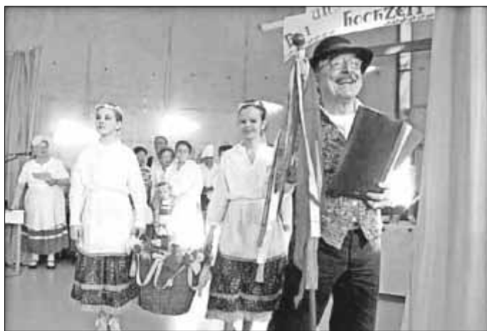
Eindrücke einer wolgadeutschen Hochzeit vermitteln die Mitglieder des Wolgakreises Wolfen in ihrer Aufführung.

Spannende Einblicke ins Stadtarchiv. Seltene Einblicke in das Historische Stadtarchiv Zerbst/Anhalt sind im Rahmen der 51. Zerbster Kulturfesttage möglich. Die Archivtüren im Zerbster Rathaus öffnen sich am Sonnabend, dem 5. März , im Rahmen des bundesweiten Tages der Archive. Er wird alle zwei Jahre vom Verband deutscher Archivarinnen und Archivare ausgerufen. Das Historische Archiv der Stadt Zerbst/Anhalt gilt mit seinen Beständen unter anderem als bedeutendstes anhaltisches Stadtarchiv für mittelalterliche und frühneuzeitliche Quellen. In den Blickpunkt der Öffentlichkeit und auch der Forschung ist es zuletzt vor allem durch die wiederentdeckten Handschriften des Zerbster Prozessionsspiels gekommen. Das Spiel, aber auch manches Interessante mehr, wird Inhalt der Führungen durch das Archiv sein, die am 5. März, um 10, 11, 14 und 15 Uhr stattfinden werden.