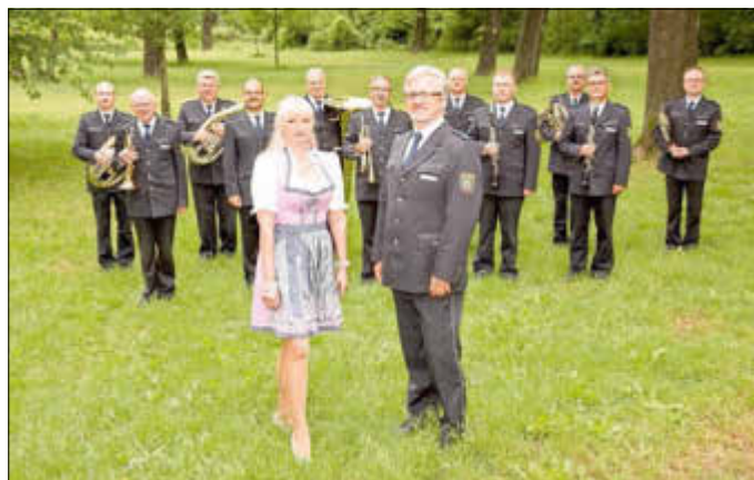
Das Landespolizei-Orchester musiziert auch in diesem Jahr beim Zerbster Stadt seniorenfest.

Bereichert werden die Konzerte durch die Sängerin Conny, die mit ihrer frischen Art durch das Programm führt.