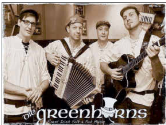
Die „GREENHORNS“ bringen ein Stück irische Lebensart in die Zerbster Nicolaikirche.

Eigenkompositionen - das Live-Programm lässt mit viel Witz und Charme die irische Lebensart hautnah erleben. Beginn der Veranstaltung ist um 19 Uhr (Einlass ab 18 Uhr). Für das leibliche Wohl wird, bei hoffentlich schönem Wetter, das Team des He Bäcker-Cateringservice sorgen. Bei Regenwetter findet die Veranstaltung in St. Trinitatis statt. Karten sind im Vorverkauf in der Zerbster Tourist-Information auf dem Markt, Telefon (03923) 2351, für 12 Euro erhältlich, an der Abendkasse für 15 Euro.