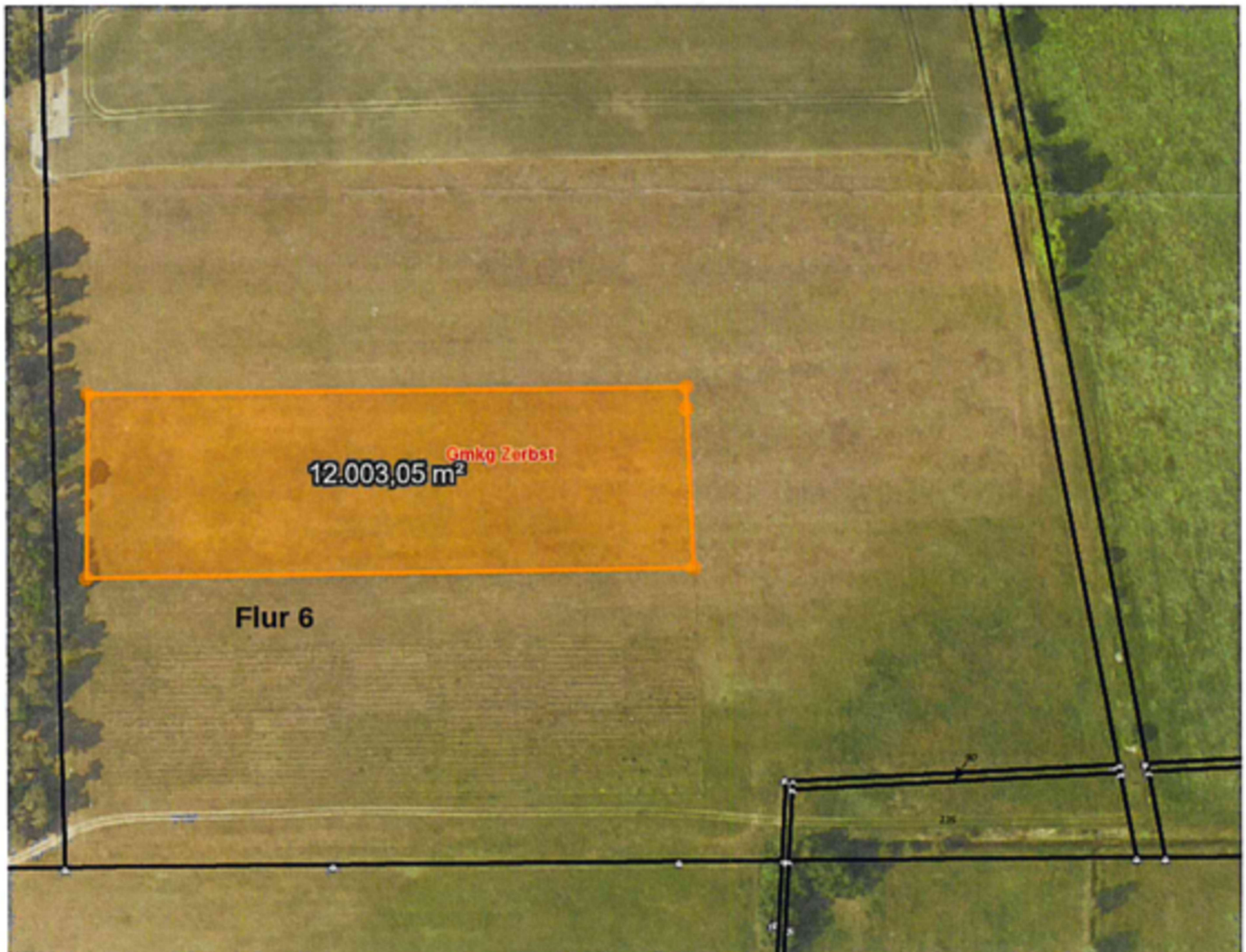
Abb. 1: Luftbild mit Lage der Erstaufforstungsfläche