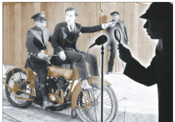
Um „Sherlock Holmes und die Stimme des Stummfilms“ geht es bei einem besonderen Filmabend am 14. September in der Zerbster Essenzen-Fabrik.

Er wird auch mit den Zuschauern manches Rätsel rund um Sherlock Holmes lösen. Ein spannender Abend voller Pointen und Geistesblitze ist garantiert.