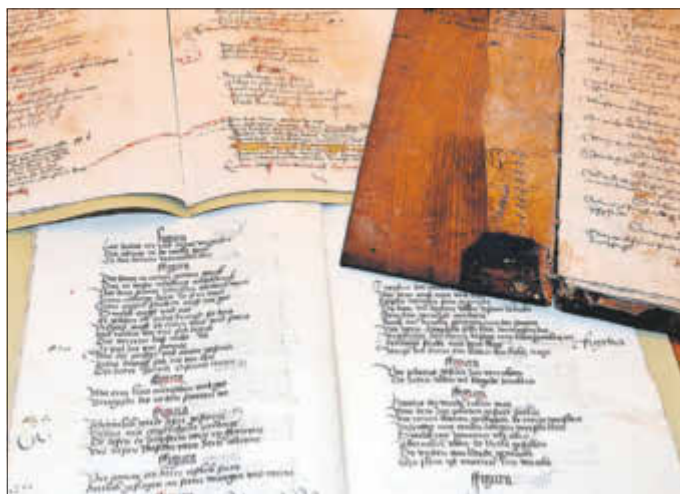
Restaurierte Schätze aus Zerbster Archiven stehen im Mittelpunkt einer Führung am Tag des offenen Denkmals.

Die Teilnehmer erhalten zur Bedeutung und Geschichte speziell ausgesuchter interessanter Objekte fachkundige Erläuterungen. Damit wird zugleich die Wichtigkeit des Erhalts dieser einmaligen historischen Dokumente deutlich.