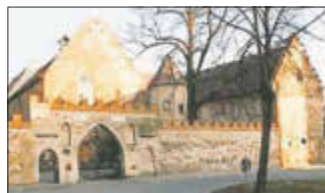
Francisceum & Museum Zerbst/Anhalt