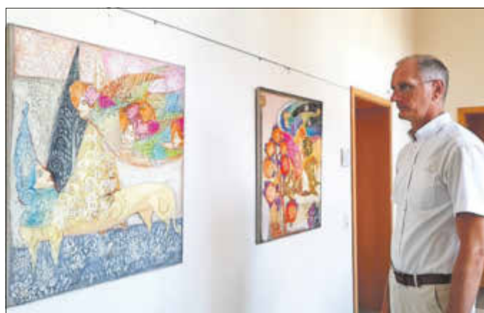
Bürgermeister Andreas Dittmann (SPD) beim Betrachten der neuen Ausstellung im Rathaus.

Die Welt der Bilder dieser Malerin wendet sich zum Gedächtnis der alten Kulturen. Darin verbinden sich die Darstellung von ägyptischen Pyramiden und dem Babelturm. Der Dionysos Nachen, der mit Delfinen umkreist ist, verwandelt sich in den Nachen des ägyptischen Gottes Ra und danach in einen goldenen Halbmond. In dieser Welt singen und tanzen griechische