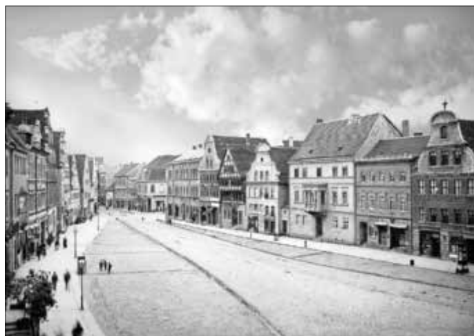
Der Zerbster Marktplatz etwa um 1920.

Sich erinnern an vergangene Zeiten, an selbst Erlebtes oder eben Neues erfahren – das ist das Anliegen dieses sicher un- terhaltsamen Abends, zu dem sich der Heimatverein über viele Gäste freut.