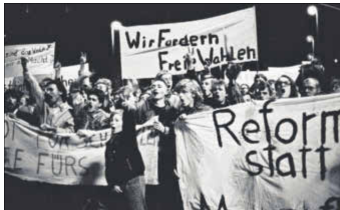
Das Foto ist am 30. Oktober 1989 auf der Montagsdemonstration in Leipzig aufgenommen worden.

Die Ausstellung „Von der Friedlichen Revolution zur deutschen Einheit“ ist derzeit in den Fluren des Zerbster Rathauses an der Schloßfreiheit zu sehen. Sie wirft Schlaglichter auf die Jahre 1989/90. Die Ausstellung erinnert an den Protest gegen die Fälschung der DDR-Kommunalwahlen, an die Fluchtbewegung im Sommer und die Massenproteste im Herbst, die die SED-Diktatur in die Knie zwangen. Sie berichtet von der Selbstdemokratisierung der DDR, der deutsch-deutschen Solidarität und den außenpolitischen