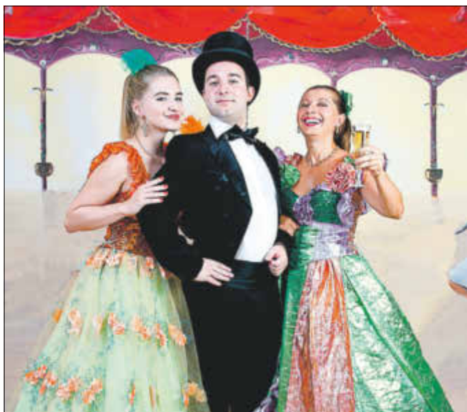
Ein prickelnder Operetten-Cocktail ist am 7. November in der Zerbster Stadthalle zu erleben.

1953, zu Beginn der Wirtschaftswunderjahre, träumt Luise Dahmann von ihrem eigenen kleinen Lebensmittelgeschäft. Drei Frauen werden immer wieder Luisens Weg kreuzen: Annabel von Thaler, die wohlhabende Arztgattin von nebenan, die junge Lernschwester Helga Knaup und Marie Wagner, geflohen aus Schlesien. Sie alle haben in den Zeiten des Aufbruchs und des Neubeginns einen gemeinsamen Wunsch: Endlich wieder glücklich sein.