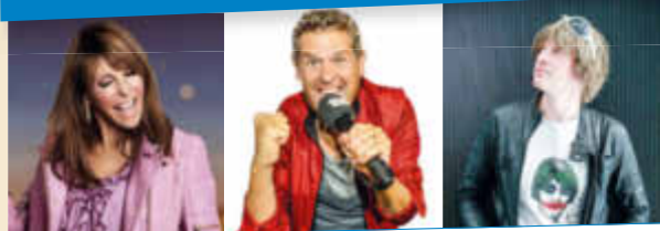
Ireen Sheer, Peter Wackel und Mickie Krause