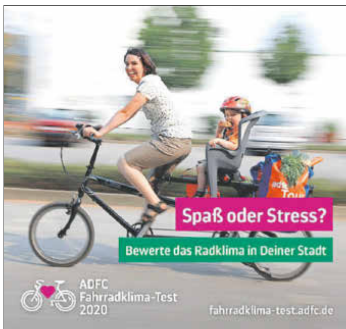
Zum neunten Mal führt der ADFC einen Fahrradklima-Test durch.

Der Allgemeine Deutsche Fahrrad-Club e. V. (ADFC) ist mit rund 200.000 Mitgliedern die größte Interessenvertretung der Radfahrerinnen und Radfahrer in Deutschland und weltweit.