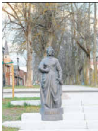
Seit 2014 steht im estnischen Võru ein Denkmal der Stadtgründerin Katharina II.