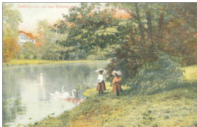
Schlosssteich mit Schloss im Hintergrund (Postkarte um 1910).

Die Teilnehmergebühr für den Rundgang beträgt 4,00 €. Karten sind in der Tourist-Information erhältlich.