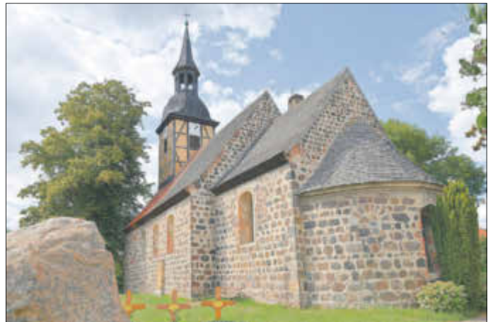
In der Radwegekirche Steckby hat die neue Saison begonnen.

Giebel des Schiffes sitzt ein Fachwerkreiter aus dem 18. Jahrhundert. Die Fensteröffnungen blieben nicht im Original erhalten, sind aber in ihren ursprünglichen Umrissen zu erkennen, ebenso wie die jetzt vermauerten Portale an der Nord- und Südseite. Die Bronzeglocke der Kirche stammt aus dem Jahr 1876, die Zuberbier-Orgel aus dem 18. Jahrhundert. Der schlichte barocke Altaraufsatz ist ein Geschenk des Herzogs Leopold Friedrich und trägt das Gemälde „Noli me tangere“ – „Berühre mich nicht“: Maria Magdalena begegnet dem auferstandenen Christus. Seit 1996 ist die Kirche im Besitz von modernen Fenstern, die vom Magdeburger Künstler Richard Wilhelm gestaltet wurden.