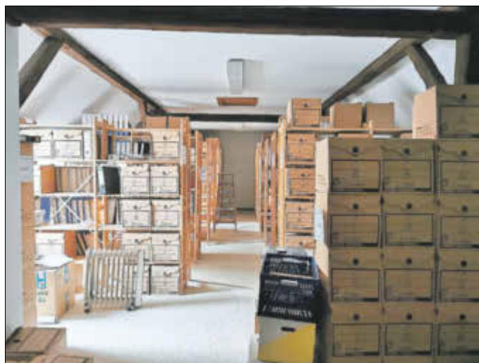
Fast 5000 Aktenordner und ca. 200 weitere Kisten sind aus Lindau (Foto) in die neuen Stadtarchiv-Räume im Zerbster Frauenkloster umgezogen.

tigung mit den alten Beständen in den nächsten Jahren. Ausreichend Platz und gute Arbeits- sowie Lagerungsbedingungen bieten die neuen Räumlichkeiten im Frauenkloster mit Sicherheit.