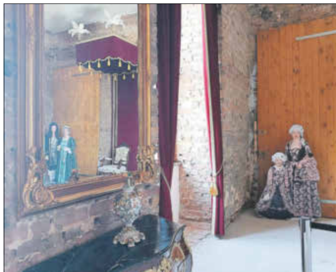
Auch das Appartement des letzten Zerbster Fürsten Friedrich August bietet den Besuchern des Zerbster Schlosses in dieser Saison Neues.

Marta Tarallo ist eine große Liebhaberin des Zero-Waste-Lebensstils und Expertin für den Bereich Beauty und Körperpflege. In diesem Buch zeigt sie Ihnen 20 Rezepturen für Naturkosmetik, mit der Sie sich von Schopf bis Zeh gesund und schön pflegen können. Sie erfahren, wie Sie Schritt für Schritt eigene, natürliche Produkte für den ganzen Körper herstellen können.