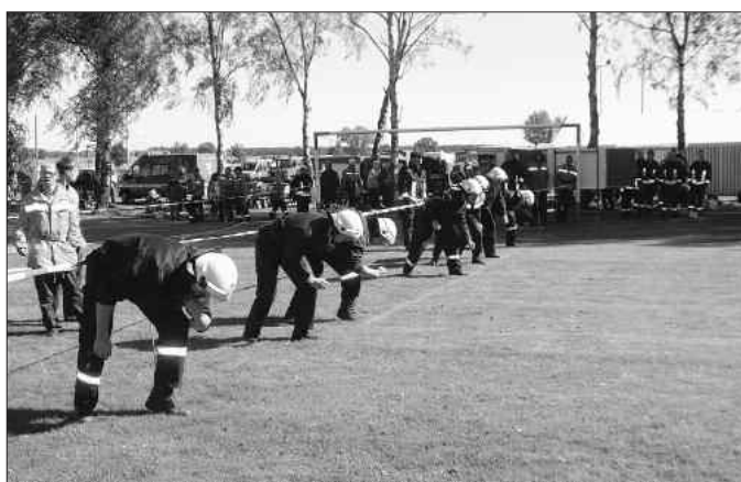
Spannende Feuerwehrwettkämpfe sind am Sonnabend ab 09:00 Uhr auf dem Sportplatz in Bias zu erleben

Zusätzlich führt der Landkreis Anhalt-Bitterfeld den Qualifizierungslauf zum Landesausscheid in der Disziplin „Gruppenstafette“ der Frauen durch.